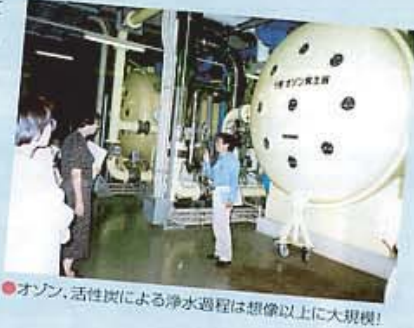
●オゾン、活性炭による浄水過程は想像以上に大規模!

毎年好評いただいている施設見学会を9月8日に実施しました。34名の参加者は、大阪府営水道「村野浄水場」で高度浄水処理水の行程を見学、「滋賀県立琵琶湖博物館」では水の歴史と現在を学び、あらためて身近な水について理解を深めていただきました。