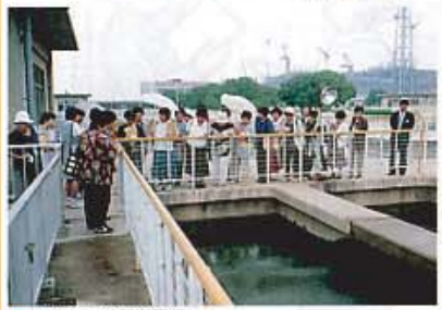
●村野浄水場見学風景