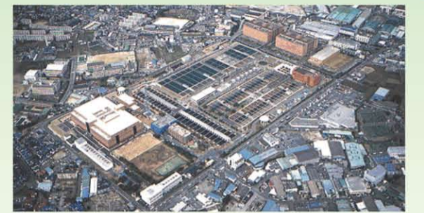
大阪府営水道・村野浄水場