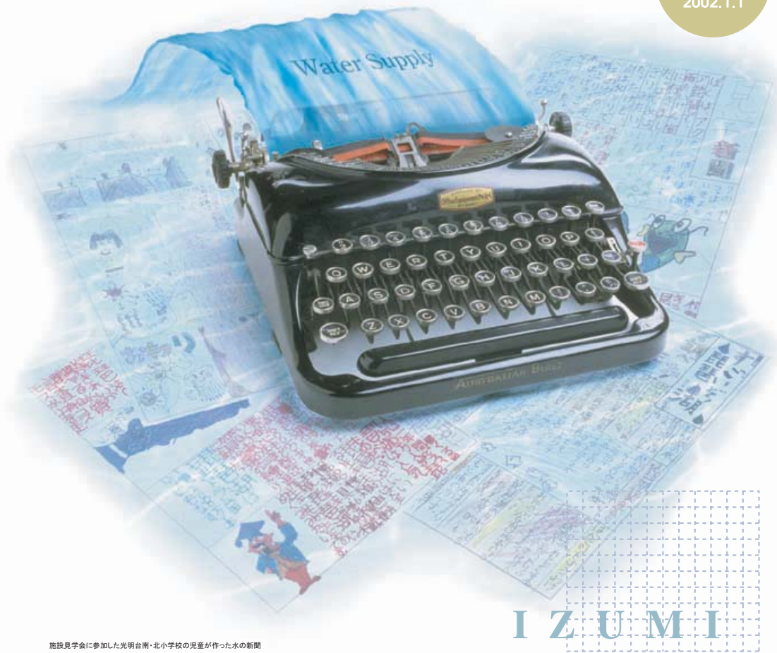
施設見学会に参加した光明台南・北小学校の児童が作った水の新聞