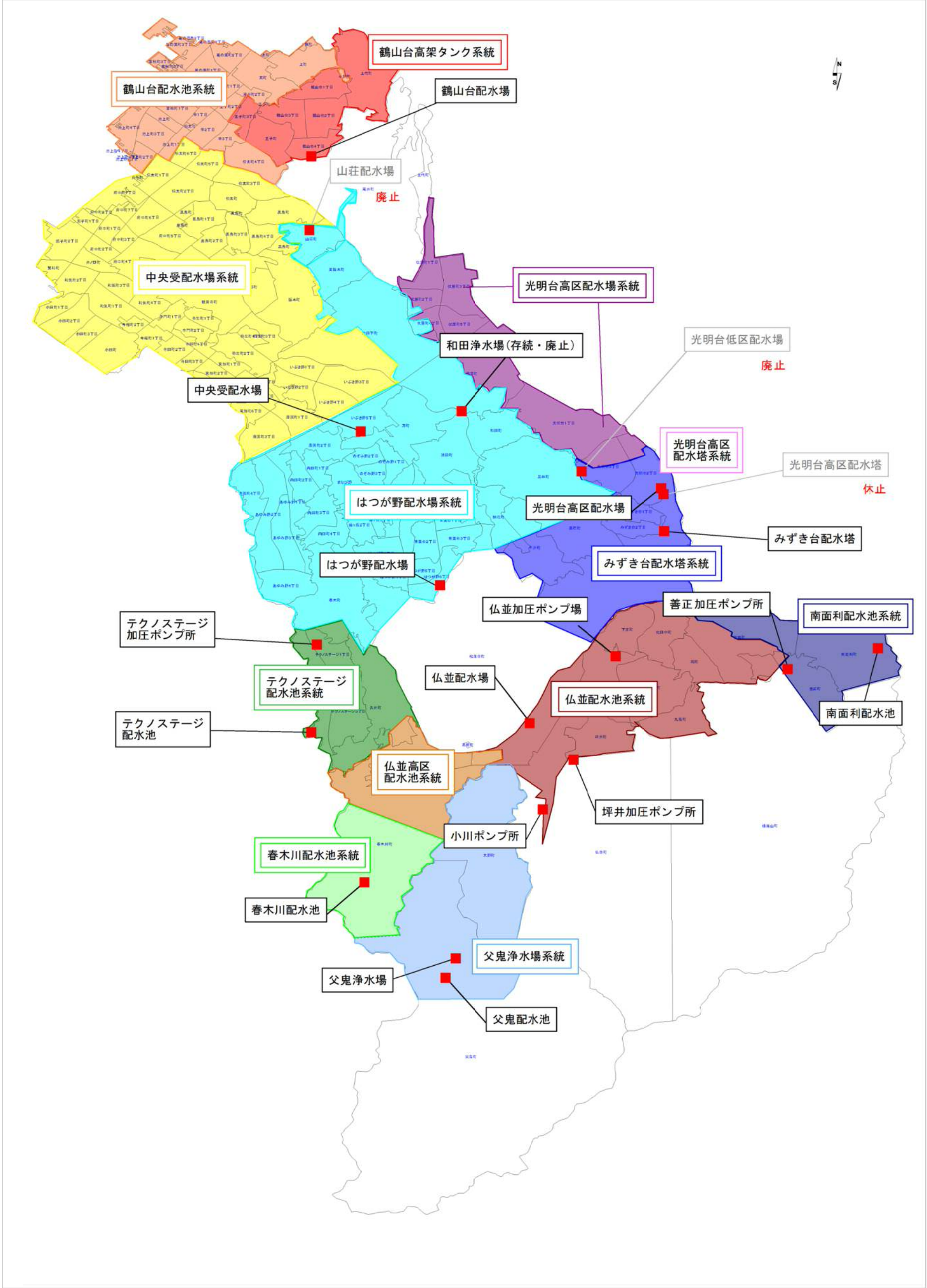
図 5-3 和泉市水道事業一般平面図 (計画後)